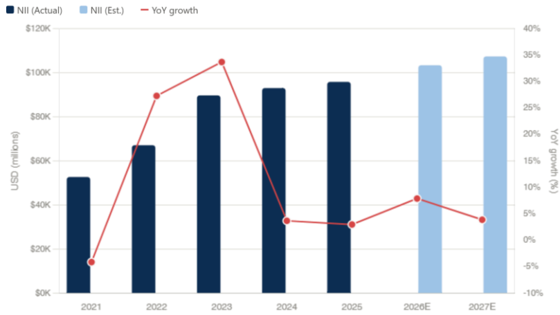
Figure 1: Net Interest Income