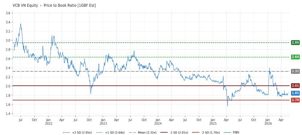
Figure 3: Forward Price to Book Ratio