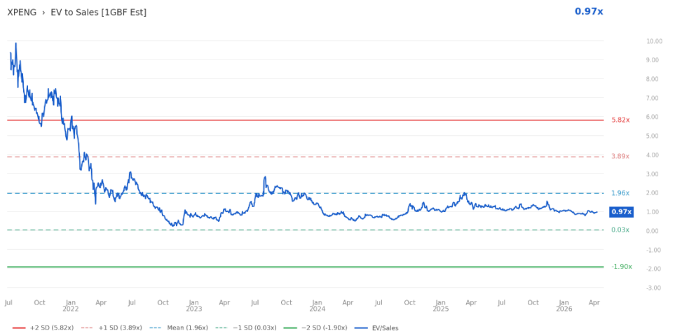
Figure 3: EV to Sales